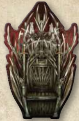
Жетон Залізного трону

Примітка. Залізний трон не переходить до іншого гравця, поки не завершиться боротьба за трек Залізного трону. Це означає, що гравець, який досі має жетон Залізного трону, розв'язує можливу нічию під час боротьби за трек Залізного трону, навіть якщо потім він утратить цей жетон.