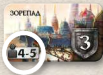
Використовують у грі вчотирьох або в'ятьох

Наприклад, у грі втрьох викладіть жетони нейтральних лордів з позначкою «3».