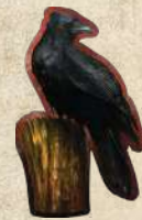
Жетон поштового ворона

↳ Замінити жетон наказу. Власник ворона може замінити невикористаним наказом один зі своїх раніше викладених наказів.