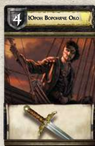
Карта Дому Грейджой

Учасники бою потайки одне від одного вибирають по одній карті Дому з руки. Коли обидва гравці виберуть карти, вони одночасно відкривають їх. Якщо карти мають особливі властивості, їх негайно застосовують.