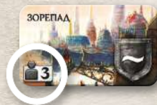
Використовують лише у грі втрьох

Усі жетони нейтральних лордів двосторонні. Одну сторону використовують лише в партіях утрьох, а іншу — у грі з більшою кількістю гравців. Розмістивши потрібні жетони нейтральних лордів, решту жетонів лордів покладіть у коробку.